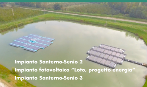
Impianto Santerno-Senio 2 Impianto fotovoltaico "Loto, progetto energia" Impianto Santerno-Senio 3

Ritrovo visite: Centrale di pompaggio Santerno-Senio 2, via Molinello angolo via Ordiere, Solarolo (Ra).