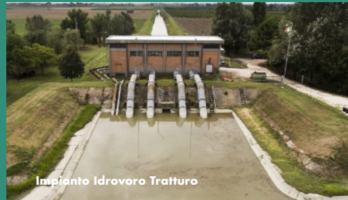
Impianto Idrovero Tratturo

Ritrovo visite: via Reale (S.S. n° 16), ingresso tra via Stroppata e via Valeria, Alfonsine (Ra)