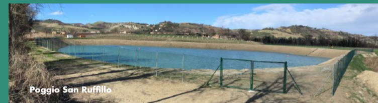
Poggio San Ruffillo

Ritrovo visite: Sede ambito montano del Consorzio, via Castellani 26 Faenza (Ra).