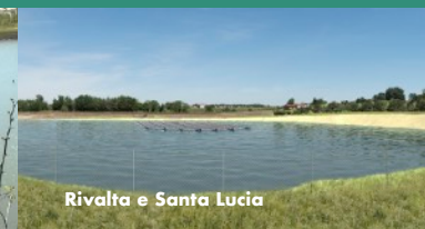
Rivalta e Santa Lucia