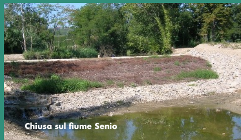
Chiusa sul fiume Senio

Ritrovo visite: Via Cuorbalestro, 52 Alfonsine (Ra)