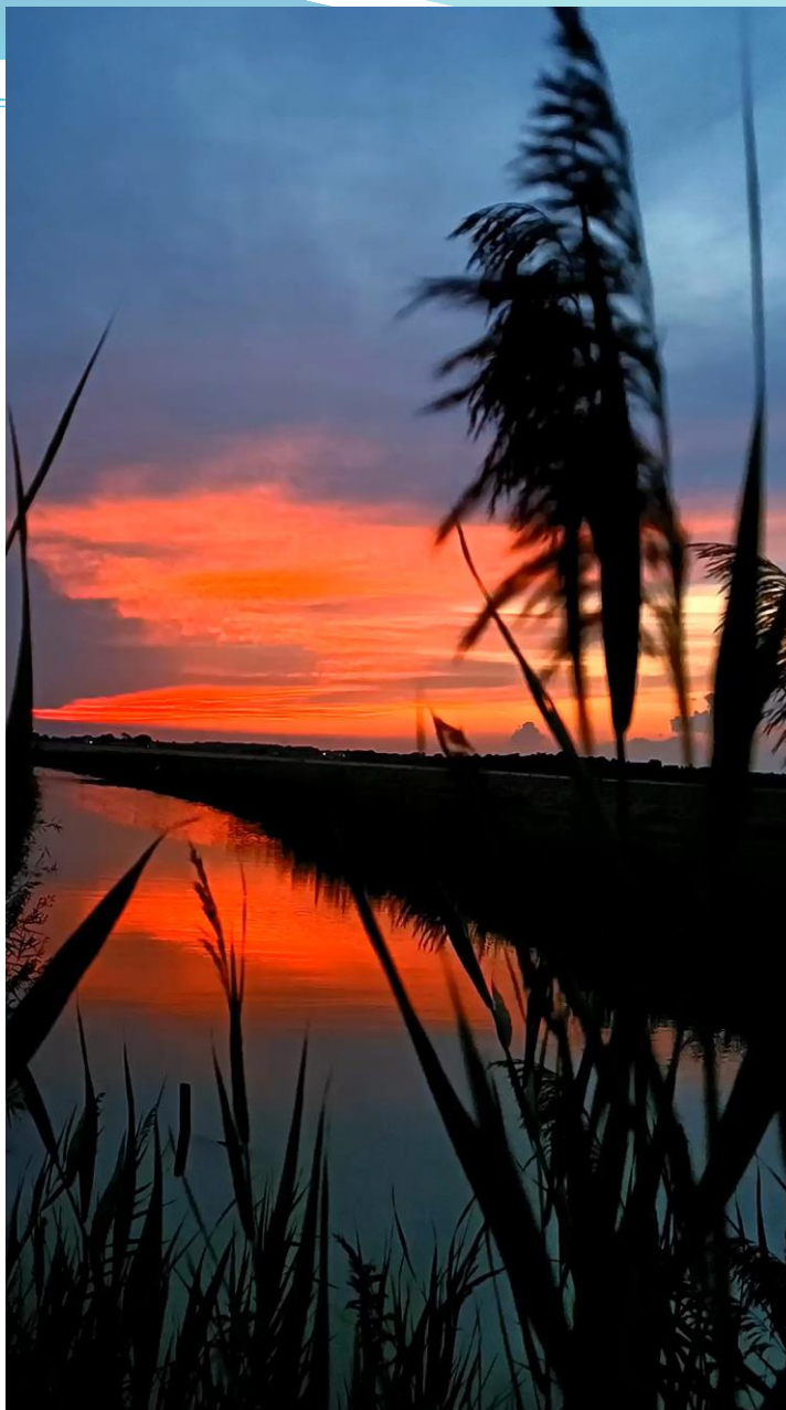
«Lontano dalla Guerra»